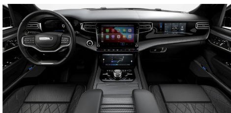
グローバルブラックパレルモレザートリム シートwithマッサージ(Obsidian)