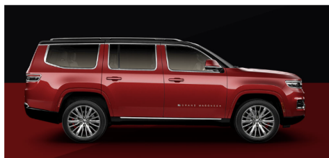
ベルベットレッドパールコート/ブラッククリアコート(ツートン)(シリーズI/II/III)(OP)