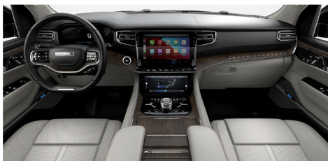
シーソルト/ブラックナッパレザートリムシ ートwithマッサージ(Series I)