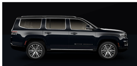
ミッドナイトスカイ/ブラッククリアコート(ツートン)(OP)