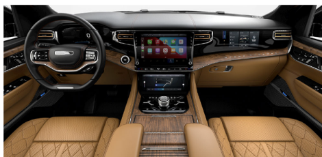
チュペロ/ブラックキルティングパレルモレ ザートリムシートwithマッサージ(Series III)