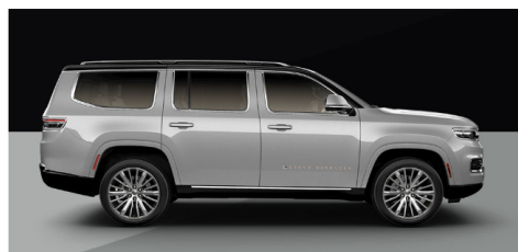
シルバージェニス/ブラッククリアコート(ツートン)(OP)