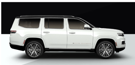
ブライトホワイトクリアコート/ブラッククリアコート(ツートン)