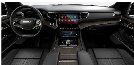
グローバルブラックナッパレザートリム シートwithマッサージ(Series I)