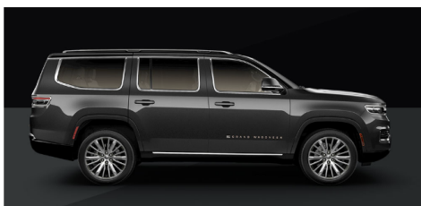
パールチェックグレーメタリッククリアコート/ブラッククリアコート(ツートン)(OP)