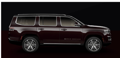
エンバーパールコート/ブラッククリアコート(ツートン)(OP)