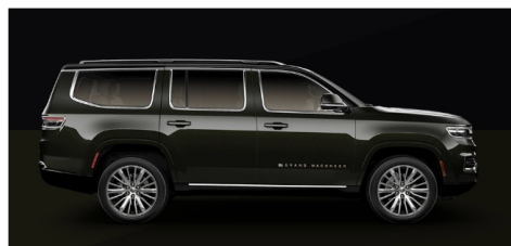
ロッキーマウンテンパールコート/ブラッククリアコート(ツートン)(シリーズI/II/III)(OP)