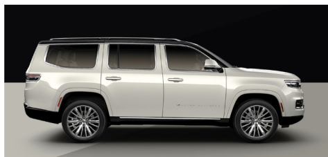
ラグジュアリーホワイトパールコート/ブラッククリアコート(ツートン)(シリーズI/II/III)(OP)