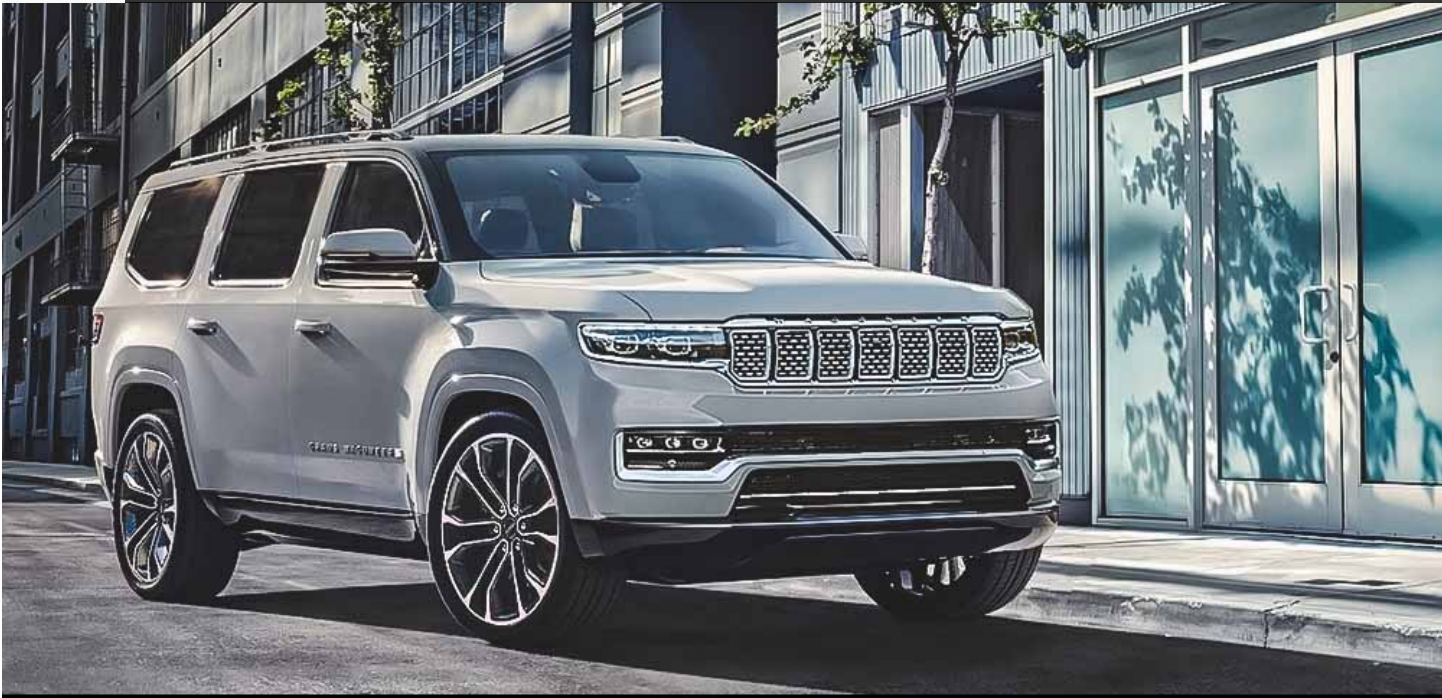
WAGONEER GRAND WAGONEER