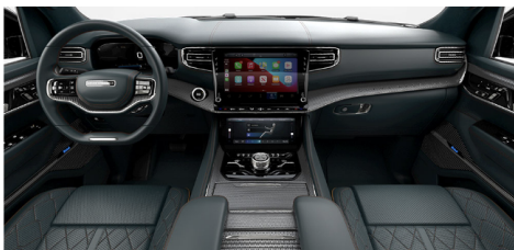
ブルーアガベパレルモレザートリムシートwith マッサージ、エンボズドメタルインテリアア クセント(Series II)(OP)