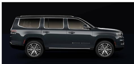
リバーロック/ブラッククリアコート(ツートン)(シリーズI/II/III)(OP)