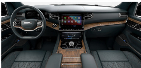
ブルーアガベパレルモレザートリムシートwith マッサージ、ナチュラルウォールナットウッ ドインテリアアクセント(Series II)(OP)