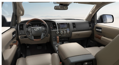
サンドベージュレザー(Platinum)