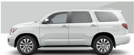
ウインドシルパール(OP)