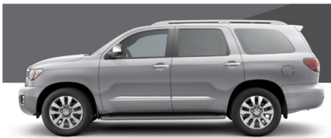
セレスティアルシルバーメタリック (SR5/Limited/Platinum)