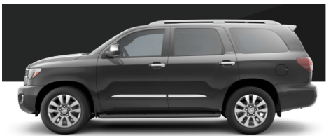
マグネティックグレーメタリック