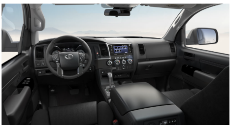
ブラックファブリック(TRD Sport)