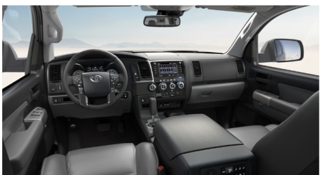
グラファイトレザー(SR5)(OP)