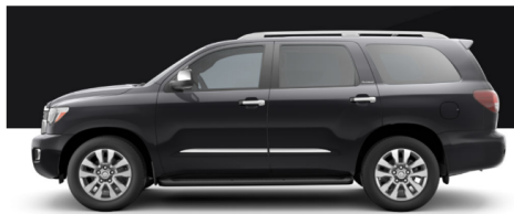
ミッドナイトブラックメタリック