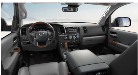
グラファイトレザー(Platinum)