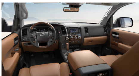
レッドロック & ブラックレザー(Platinum)