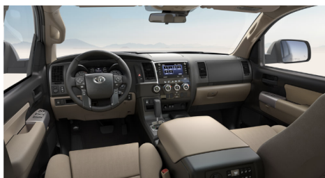
サンドベージュファブリック(SR5)