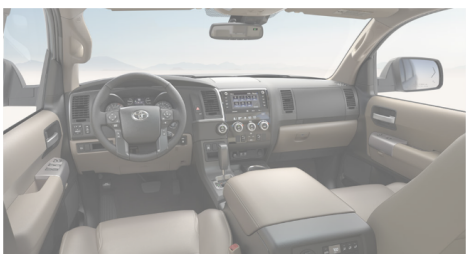
サンドベージュレザー(Limited)