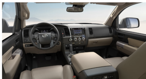
サンドベージュレザー(SR5)(OP)