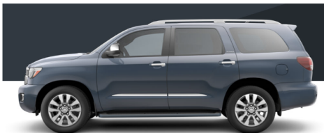
ショアラインブルーパール (SR5/Limited/Platinum)