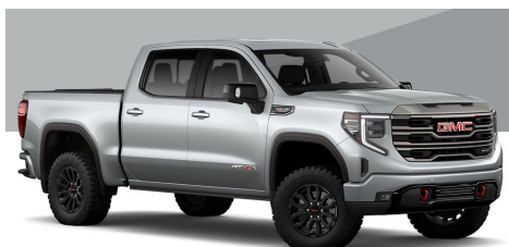
クイックシルバーメタリック