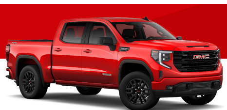
カーディナルレッド(PRO/SLE/ELE)