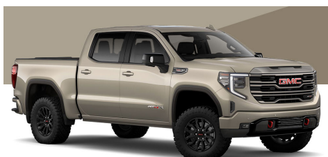
デザートサンドメタリック(ELE/AT4/AT4X)