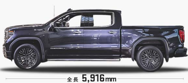
GMC SIERRA, Crew Cab, Short Box