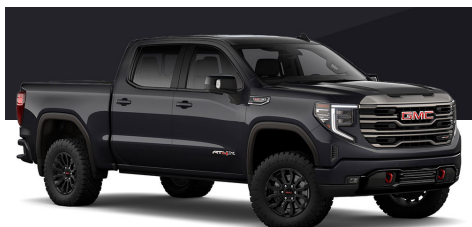
チタニウムラッシュメタリック (SLE/ELE/SLT/AT4/AT4X)