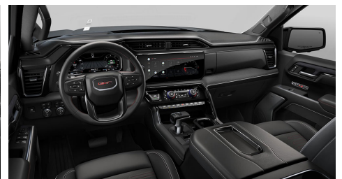
オブシディアンラッシュ、フルグレインレ ザーフロントシートトリム(AT4X)