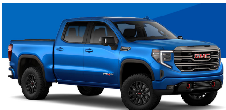
ダイナミックブルーメタリック (ELE/AT4/AT4X)