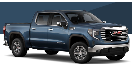
パシフィックブルーメタリック(PRO/SLE/SLT)