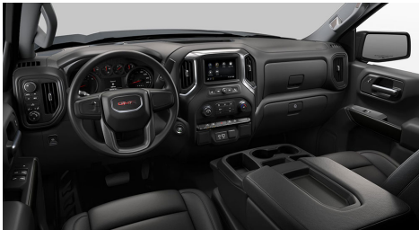
ジェットブラック、ビニールシートトリム (PRO)