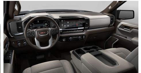
ダークウォルナット/スレート、クロスシート トリム(SLE)