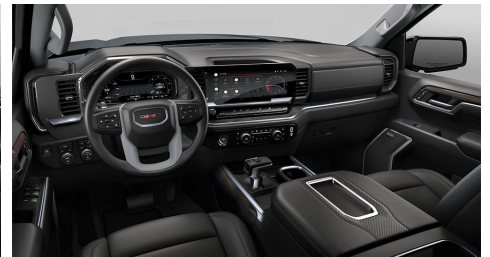
ジェットブラック、パーフォレーテッドレ ザーアポイントッドフロントアウトボ ードシートトリム(SLT)