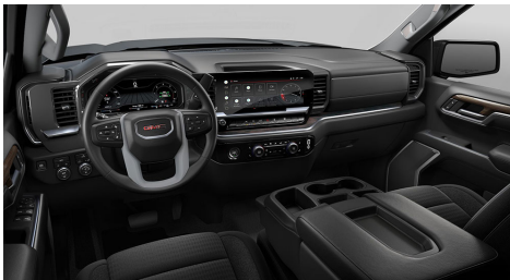
ジェットブラック、クロスシートトリム(ELE)