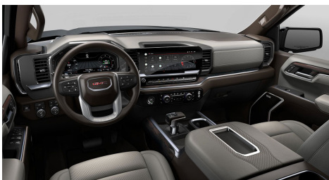
ダークウォルナット/スレート、パーフォレー テッドレザーアポイントッドフロントアウト ボードシートトリム(SLT)