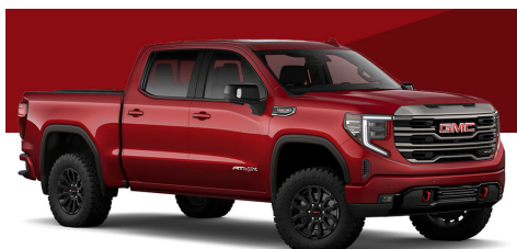
カイエーンレッドティントコート (ELE/SLT/AT4/AT4X)