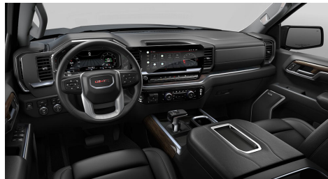
ジェットブラック、レザーアポイントッドフ ロントシートトリム(ELE)