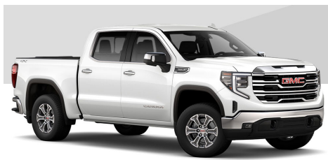
ホワイトフロストトリコート(SLT)