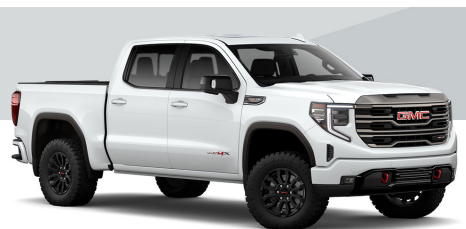
サミットホワイト