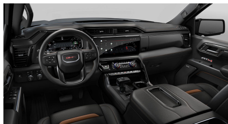
ジェットブラックwithカラハリアクセント、 パーフォレーテッドレザーフロントシート トリム(AT4)