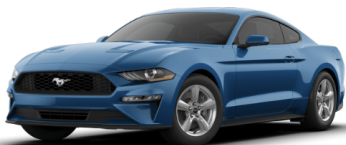
ベロシティブルー