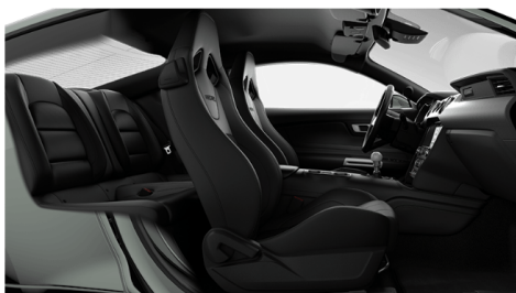
エボニーRECAROレザーwithグリーンス ティッチ(OP)