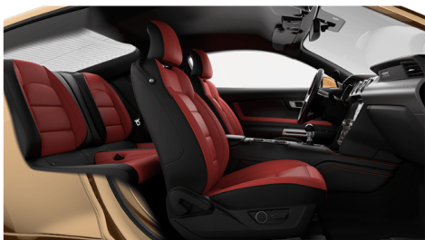
ショーストッパーレッド(OP)