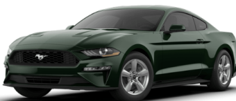
ダークハイランドグリーン ※BULLITT専用色

※BULLITTは「シャドーブラック」、「ダークハイランドグリーン」2色のみとなります