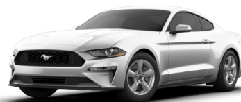
オックスフォードホワイト