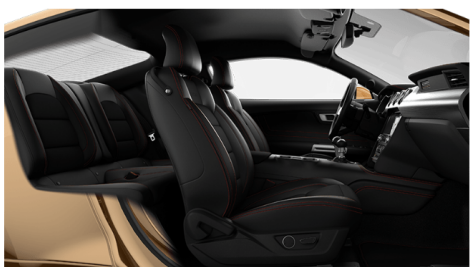
エボニーレザーwithミコインサート (OP)※3