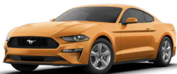
オレンジフューリー (OP)