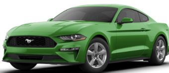
ニードフォーグリーン ※エボニーレーシングストライプ必須