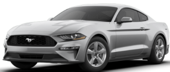
インゴットシルバー