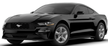
シャドーブラック