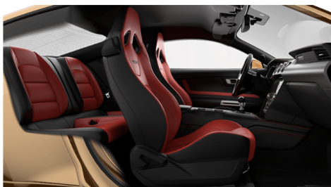
ショーストッパーレッド(OP)