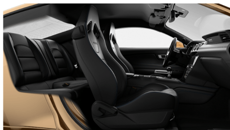
ミッドナイトブルーwithグラバーブルー ステッチ(OP)