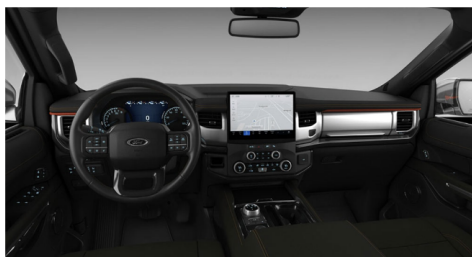
ディープスペースパーフォレーテッドクロ ス/ビニール(TIM)