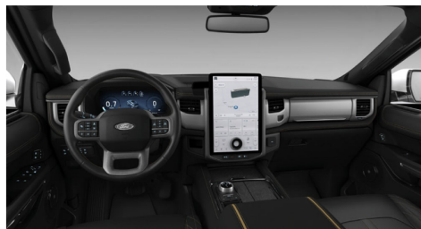
ブラックオニクスレザーシートwithレッドス ティッチング(LTD)