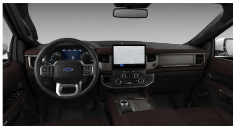
マホガニーリミテッドレザーシート (LTD)