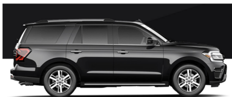
アガットブラックメタリック