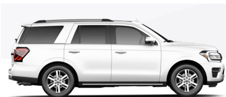
オクスフォードホワイト (STX/XLT/LTD/TIM/KIN)