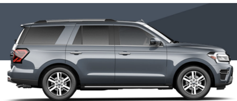
インフィニティブルーメタリックティントクリ アコート(XLT/LTD/TIM/KIN/PLA)