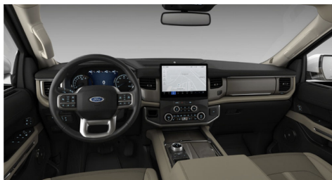
サンドストーンSXTクロスシート(XLT/LTD)