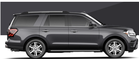
ダークマターメタリック(XLT/LTD/TIM/PLA)