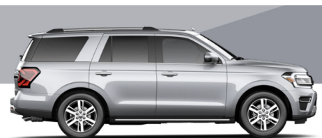
アイコンックシルバーメタリック (STX/XLT/LTD)