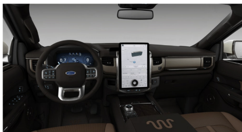
ジャバ、King Ranch®デルリオレザーシート (KIN)