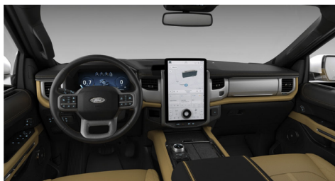
カーメロラグジュアリーレザーシート(PLA)