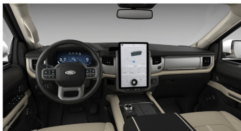
ライトサンドストーンラグジュアリーレザー シート(PLA)