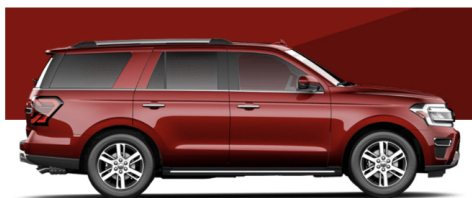
ラピッドレッドメタリックティントクリア コート(XLT/LTD/KIN/PLA)