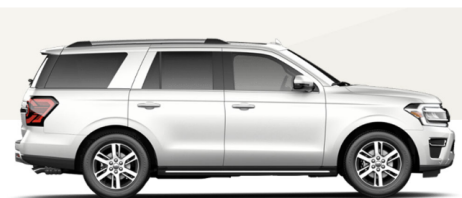
スターホワイトメタリックトリコート (XLT/LTD/TIM/KIN/PLA)