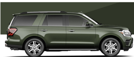
フォードグリーンメタリック